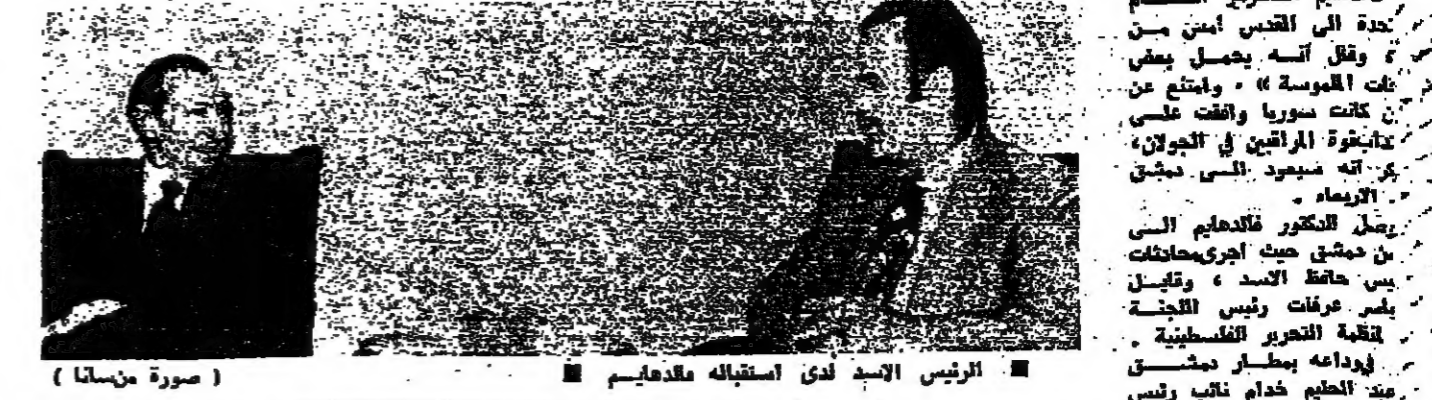
الرئيس الاسرائيلي الذي استقبله فلاحايم (صورة من اسفله)